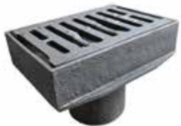
ŻELIWO DROGOWE ROAD CAST IRON