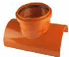
RURY I KSZTAŁTKI PIPES AND FITTINGS