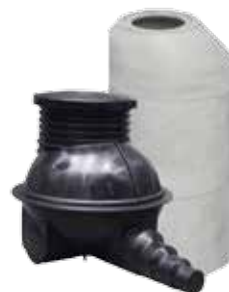
STUDNIE KANALIZACYJNE SEWAGE WELLS