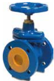
ARMATURA ŻELIWNA CAST IRON FITTINGS