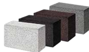
GALANTERIA BETONOWA ROAD CONCRETE